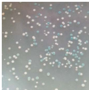
图2. pUCm-T载体的蓝白斑筛选结果示意图。pUCm-T载体和PCR产物片段进行连接，转化后在IPTG/X-Gal平板的上长出的克隆，其中白色克隆代表PCR产物片段可能插入到pUCm-T载体中，但后续还需要酶切、PCR或者测序确认。